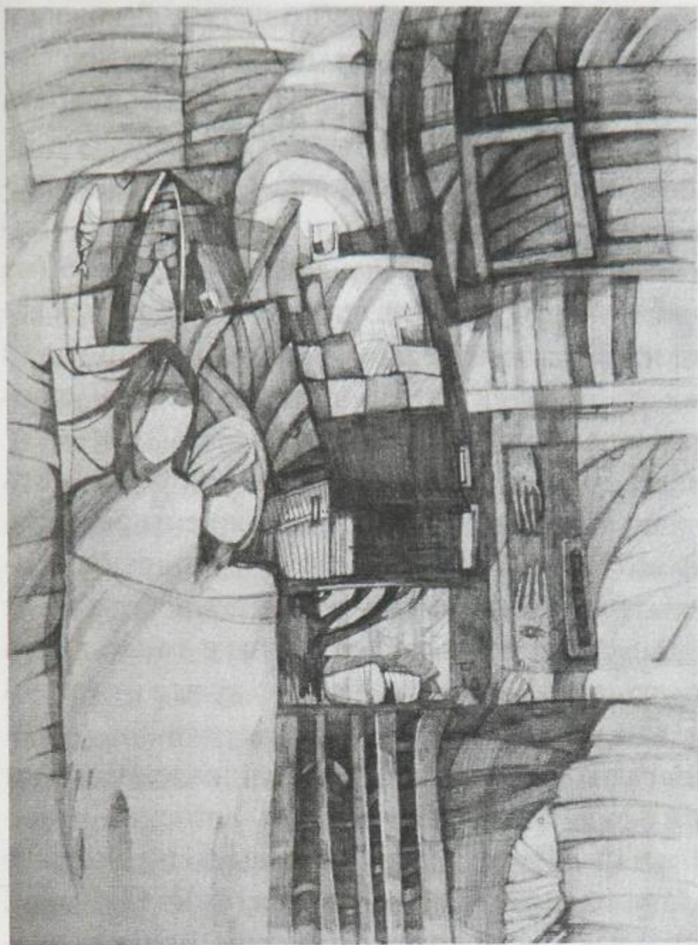
А. Долгих. ПОКОЙ (СЕРИЯ «ДВОЕ»). 2011

нованным в «Свободный союз для распространения хорошей игры на гитаре». Перевод и выпуск русского «Гитариста» инициировало русское отделение Союза, обогатив журнал биографическими очерками о выдающихся гитаристах, «так как история и успехи каждого инструмента до известной степени обуславливаются индивидуальностью его представителей». В итоге первоначально «задуманный простой перевод журнала обратился как бы в самостоятельный исторический очерк из новейшей, современной нам истории гитары» [Заяицкий 1902: С. 4].