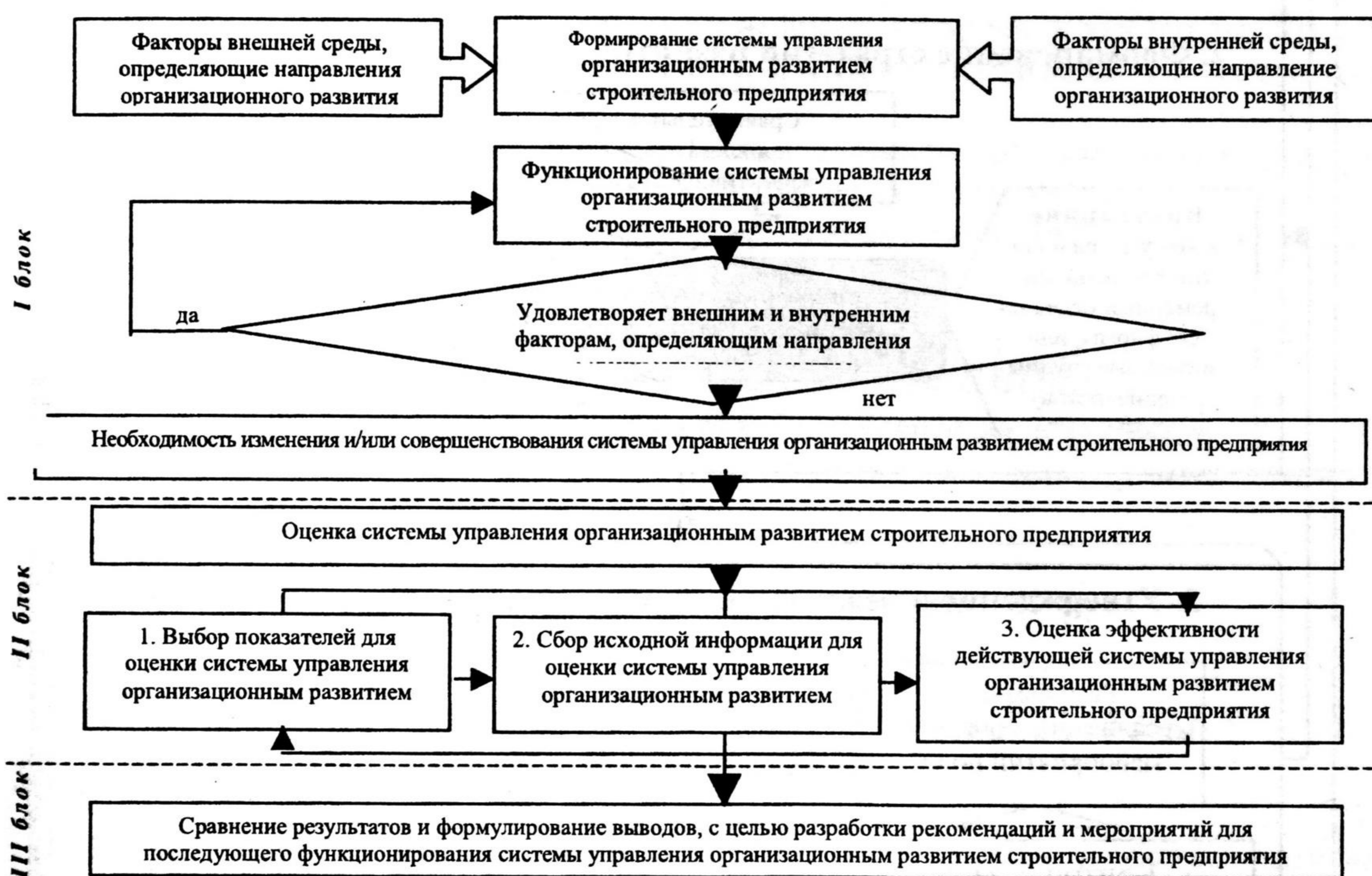
Рис. 1. Методический подход к оценке системы управления организационным развитием строительного предприятия

Процессное представление позволяет разработать логическую модель управления организационным развитием строительного предприятия. Основные этапы представлены автором на рис. 2.