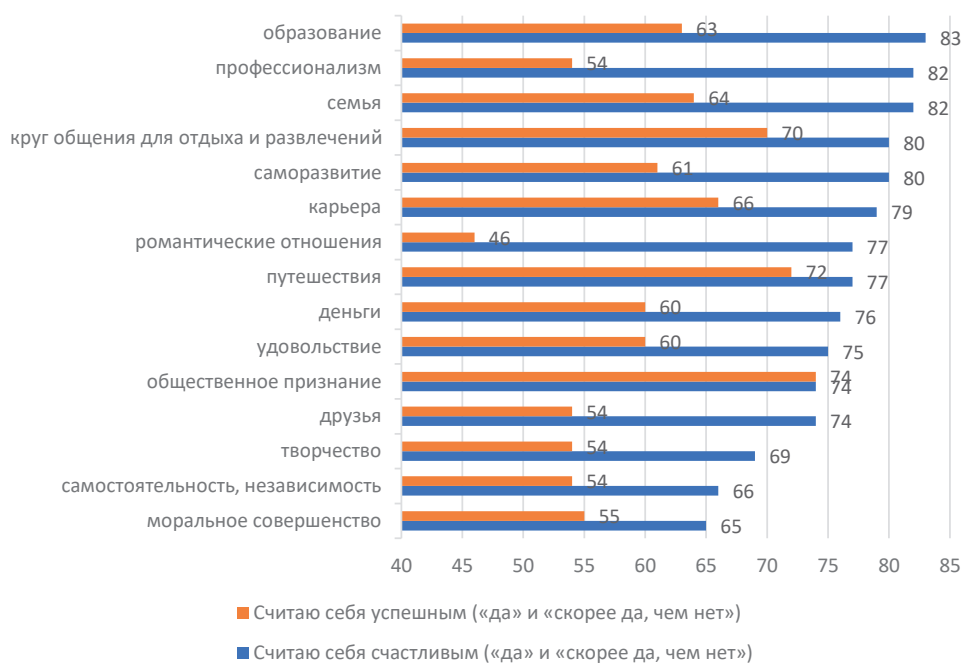
Рис 1. Распределение ответов респондентов на вопросы: «Считаете ли Вы себя счастливым человеком?», «Считаете ли Вы себя успешным человеком?» в зависимости от приоритетных жизненных ценностей (в % к числу опрошенных) Figure 1. Distribution of respondents' answers to the questions: "Do you consider yourself a happy person?", "Do you consider yourself a successful person?" depending on the priority values of life (% of the number of respondents)

Ценностями, демонстрирующими сравнительно невысокий уровень счастья выбравших их респондентов, стали творчество (69%), независимость (66%) и моральное совершенство (65%). Но, сопоставляя полученные результаты с ответами на аналогичный вопрос с фокусом на успешность, эти показатели сложно назвать низкими: среди множественности ответов, относящихся к самоощущению успешности, такие ценности, как друзья (54%), романтические отношения (46%) независимость (54%), профессионализм (54%) и творчество (54%) занимают еще более низкие позиции. Таким образом, стереотипно карьерная ценность — профессионализм — не становится значимой в самоощущении человеком себя как успешного. Наоборот, такие далекие от работы ценности, как возможность путешествовать (72% респондентов, выбравших эту ценность, считают себя успешными), круг общения для отдыха и развлечений (70%) оказываются более ведущими к ощущению успеха. Лидером в этом списке стало общественное признание (74%). Отмеченное лидирующее положение по отношению к успешности возможности путешествовать, круга для общения и развлечений приводит к пониманию, что понятие успеха для современной молодежи все сильнее отдаляется от карьерных установок, профессиональных достижений. Молодежь демонстрирует приоритетную концентрацию на получении удовольствия от жизни, гедонистических настроениях.