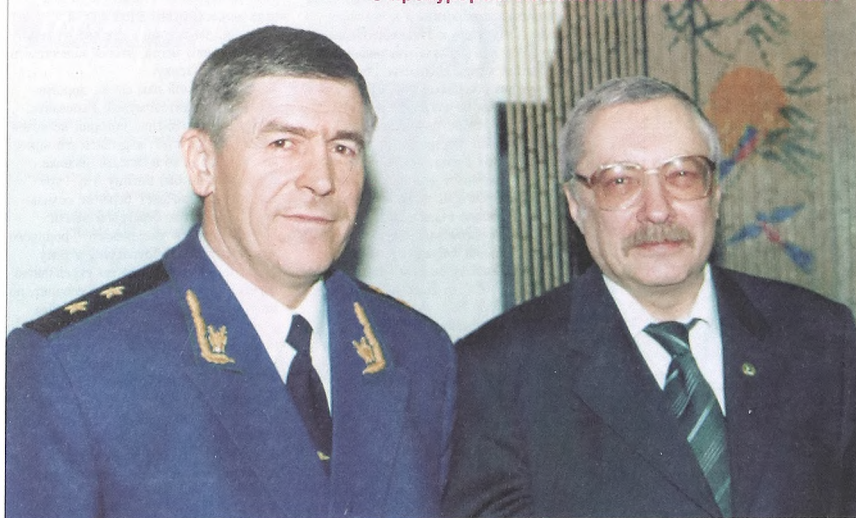
С прокурором Тюменской области Э.Валеевым.