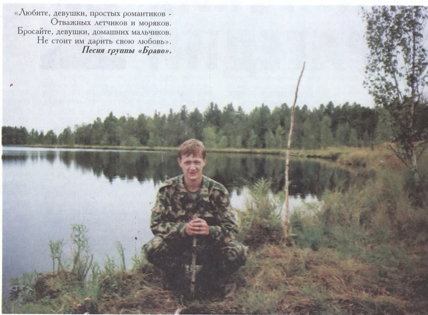
«Любите, девушки, простых романтиков - Отважных летчиков и моряков. Бросайте, девушки, домашних мальчиков. Не стоит им дарить свою любовь». Песня группы «Браво».

- Где я только не побывал! На первом курсе нас периодически вывозили за пределы Тюмени, в разные места Тюменского района. Особенно запомнилась поездка на практику после второго курса, когда нас на целый месяц всем курсом повезли под Туапсе на базу отдыха «Солнышко», принадлежащую университету. В поезде мы занимаем полтора вагона. Отдохнули здорово, несмотря на то, что было 4 вида практики.