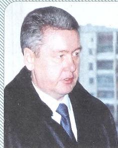
Тюменский губернатор Сергей Собянин