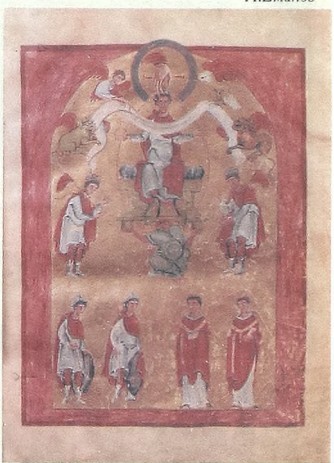
Evangeliar Otton III.. Huldigungsblatt

Было решено организовать подобный семинар в следующем семестре. А.Еманов