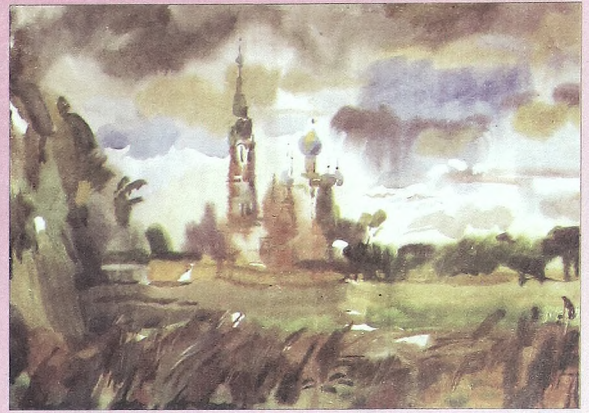
А.Левина «Храм Покрова. Тарасовка» 2000г.

В.Шилову удалось пушкинский портрет в Михайловском. Шиловский «пятнистый» мазок текуч и сиятел одновременно - словно архапелак движущихся в истории культуры островков, уходящих от забвения. Традиционно слышна резкая кость В.Обрядовой. Д.Бобочин, уловив игру света, привлекает необычным видом на Затюменку, запечатлав недавно отстранированную Крестовоздвиженскую - Никольскую церковь. Ю.Акишев отменился графикой и (один!) социально-философским полотном о трагедии недавней перестройки. Свою тему нашел В.Сизов, написавший «Тюменские решетки» (настолько круто, что поместилась лишь одна часть). Ничего не скажешь - инно-