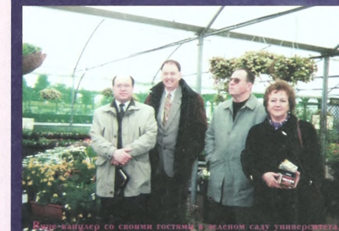
Вице-канцлер со своими гостями в теплице сада университета.

- Тут несколько причин. Во-первых, это на самом деле дорого. В год надо примерно 14-15 тысяч фунтов. У нас в стране за эти деньги можно получить пять образований. Второе. Уровень подготовки там не выше, и поэтому наши студенты занимают в западных вузах андеррайдное положение. Реакция наших первых «англичан» была такая - нам в этом «техникуме»