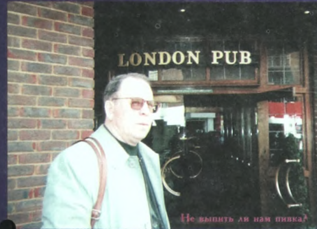
Не выпить ли нам пивка?

Другой пример: если к нам в университет приезают гости из Великобритании, я могу совершенно спокойно среди студентов найти, как минимум, тысячу человек, которые свободно