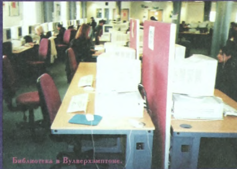
Библиотека в Вулверхэмптоне.

- Страна сильно «почернела». Много чернокочих, желтого населения. Они заняли нишу не самого квалифицированного труда. И драки я видел между черными и белыми, довольно жестокие, надо заметить. В некоторых городах соотношение черного и белого населения один к трем.