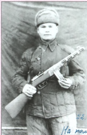
20.11.43 года На маляге родился Алексей своему Андрею

Хотя на войне бывало всякое. Так, в марте 1943 г. в первый день боев под Северским Донцом чуть-чуть не