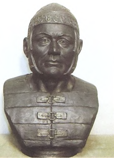
Саргатский мужчина 40-45 лет. Антропологическая реконструкция, выполненная по черепу мужчины из Старо-Лыбаевского могильника, Заводокуровский район).

Союз журналистов Тюменской области Областная организация "МедиаСоюза" России Департамент информационной политики Администрации Тюменской области Департамент информации и социально-политических исследований Администрации Ямало-Ненецкого автономного округа Комитет СМИ и полиграфии Ханты-Мансийского автономного округа Фотоагентство "Тюмень"