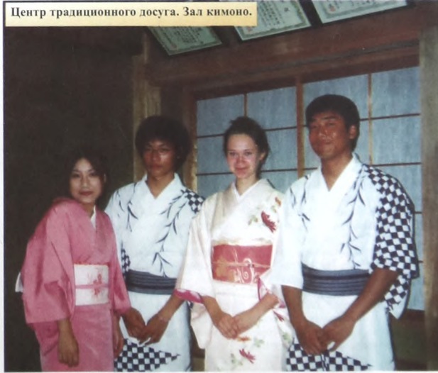
Центр традиционного досуга. Зал кимоно.