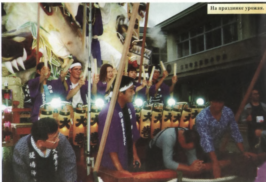
На празднике урожая.