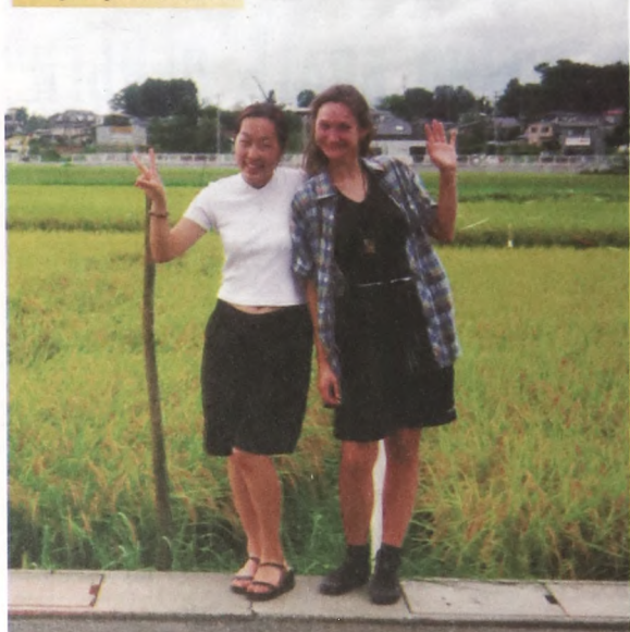
На фоне рисового поля.