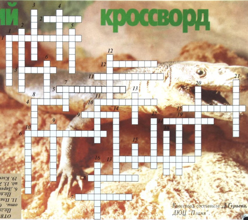
Кроссворд составила Д.Гурьева, ДЮЦ "Пламя".

По вертикали: 1. Слово, которое в переводе с греческого означает "науку о жизни", и наука, включающая в себя ботанику, зоологию, биофизику и т.д. 2. Процесс, при котором растение под влиянием солнца из воды и углекислого газа вырабатывает сахар и крахмал. 3. Экология исследует образ жизни как отдельных видов, так и целых сообществ - ... 4. Особая отрасль биологии, изучающая зависимость растений и животных от условий существования. 5. Как называются тесные связи на основе питания? 6. Ученый, сформулировавший теорию эволюции. 7. Река в Европе. 8. Ученый, который был уверен, что животные и растения не сотворены, а возникли естественным путем. 9. Группы животных какого-либо вида, обитающие в одном месте, обладающие общими признаками и отличающиеся от своих собратьев, живущих в других условиях. 10. Часть цитоплазмы, которая примыкает к оболочке клетки. 11. У растений существуют особые ... , отличающиеся внешним видом и экологическими особенностями. 12. Структуры в цитоплазме клеток эукариотов. 13. Орган, с помощью которого рыба дышит. 14. Другое название цитоплазмы. 15. Главная часть клетки. 16. Кожица листа. 17. Организм (клетка) с ядром. 18. Другое название ядра. 19. Какое строение имеют растения? 20. Энергетические подстанции клеток. 21. Запасная ткань плода.