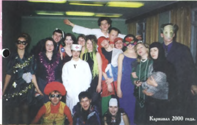
Карнавал 2000 года.