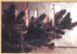
13 января 2003 года

В настоящее время обычной украшать елку во время Рождественских праздников очень широко распростра-