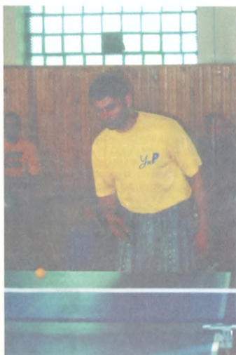
Так "игралась" победа.

Из "золотого" кубка и вода покажется медом.