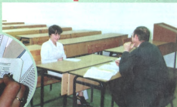
Зачет по документоведению.