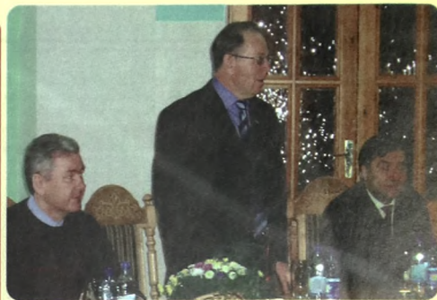
В Международный день студента губернатор Тюменской области Сергей Собянин посетил Институт государства и права ТюмГУ, где провел семинар для студентов и преподавателей. Подробности читайте в следующем номере.