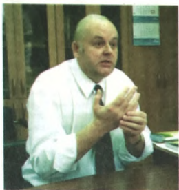
(Окончание. Начало на стр. 2)