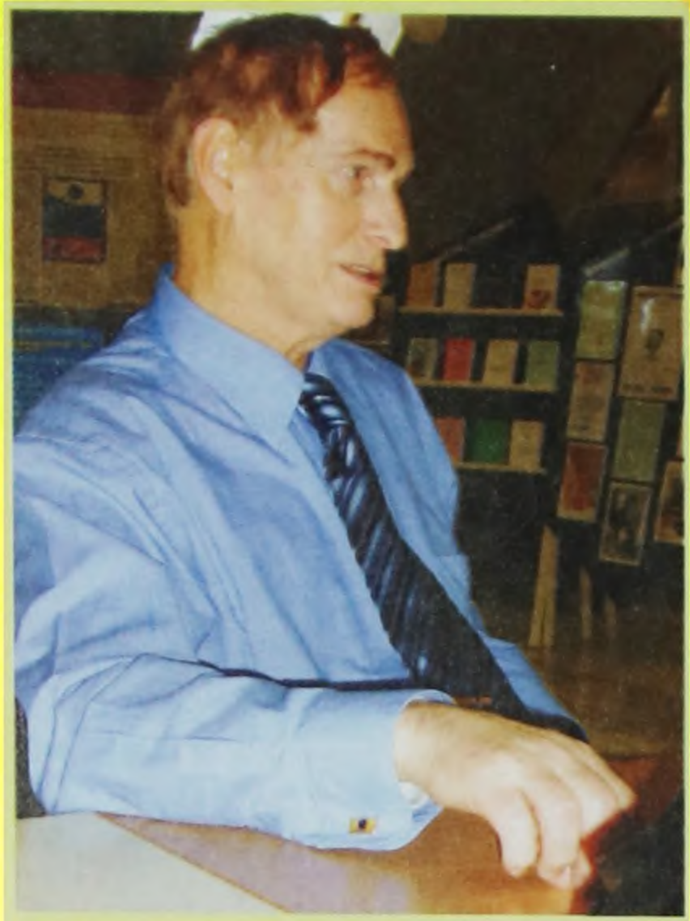
(Окончание. Начало на стр. 1)