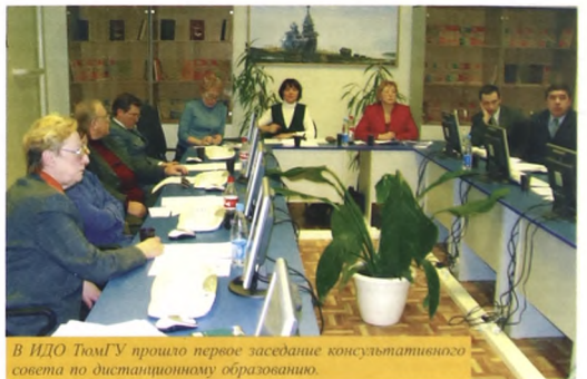
В ИДО ТюмГУ прошло первое заседание консультативного совета по дистанционному образованию.