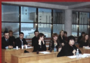
Проблемы ответственности в материальном праве, гражданском и арбитражном процессе.