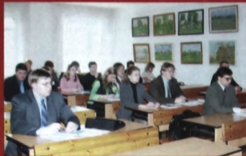
Проблемы конституционно-правовой и муниципально-правовой ответственности.