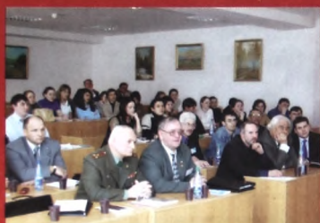
Проблемы уголовно-процессуальной ответственности.

можность выступить по острым проблемам института юридической ответственности в науке и практике.