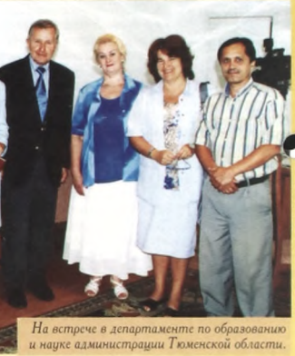
На встрече в департаменте по образованию и науке администрации Тюменской области.

С 15 по 19 августа Тюменский государственный университет посетил известный политолог, профессор Университета Фридриха Вильгельма (г.Мюнстер, Германия), доктор юриспруденции Герхард Витткемпер. Главная цель визита - подготовка заявки на совместный проект в рамках программы "ТЕМПУС" Европейского союза. В рамках трехгодичного проекта с объемом финансирования 500 тысяч евро предусматривается создание консорциума вузов Германии, Голландии и России для разработки учебных программ в области экологии с использованием современных методов дистанционного обучения. Администратором гранта выступит Университет г. Мюнстера - второй по величине вуз в Германии, в котором обучаются свыше 46 тысяч студентов.