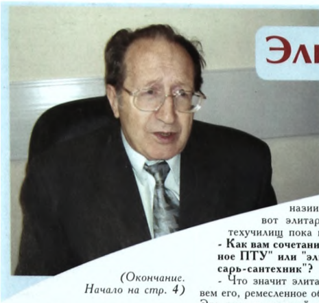
(Окончание. Начало на стр. 4)

Более всего тут представителей азиатских республик. Поэтому надо перестраивать структуру образования: сократить прием в вузы. Но надо делать это цивилизованным образом, а не душить налогами. Далее, надо расширять среднеспециальное образование и обязательно начальное профессиональное. Но профтехучилища сейчас не престижны, туда идет далеко не лучшая часть молодежи. Значит, надо продумывать меры по поднятию престижа профтехобразования: создавать комплексы, где из профтехучилища есть выходы в среднее и высшее образование. Профтехучилища стали бы первой ступенью профессионального образования, а у подобных образовательных комплексов появилось бы больше влияния. Есть идея элитного высшего образования, и идея правильная. Надо растить элиту. Должна быть и элитарная средняя школа, с чем уже согласались, появились гим-