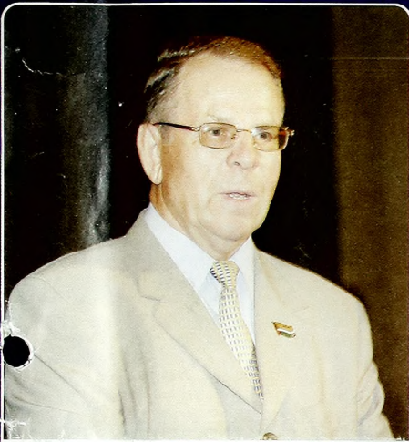
Геннадий Куцев, ректор Тюменского государственного университета:

Какое важное событие, на ваш взгляд, произошло в стране, в области и в вашей жизни в уходящем году?