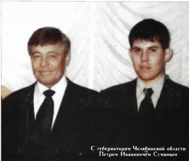
С губернатором Челябинской области Петром Ивановичем Суминым

- Говорят, что студенческие годы лучшие в жизни. А какой для тебя была жизнь в университете?