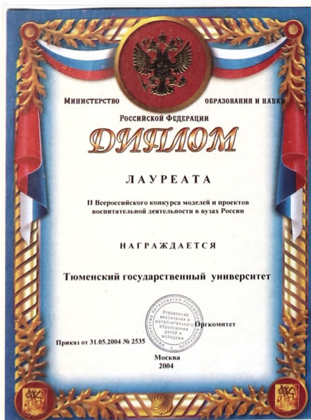
Такая награда пришла в ТюмГУ из Москвы