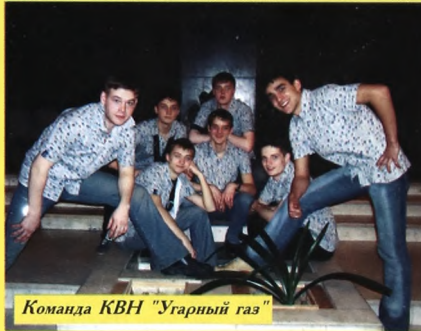
Команда КВН "Угарный газ"

В институте есть своя команда КВН "Угарный газ", работает педагогический отряд "Дельфин", студенты проявляют свои таланты в вокальной и хореографической студиях, выходит в свет студенческая газета "Культпросвет".