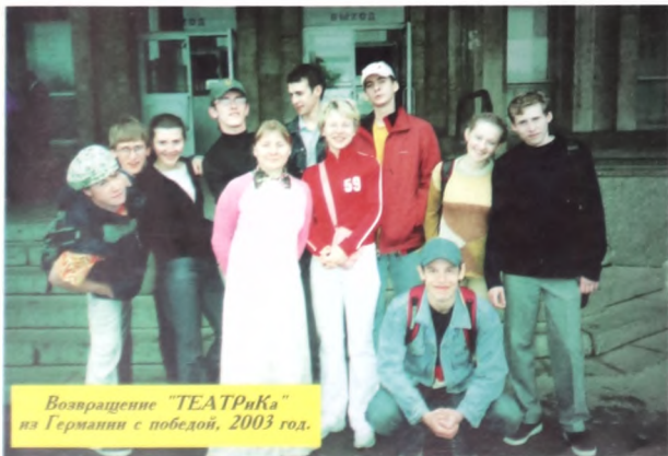
Возвращение "ТЕАТРИКА" из Германии с победой, 2003 год.

- Конечно, любый интеллектуал должен хоть раз посетить собрание в этом клубе (иронично).