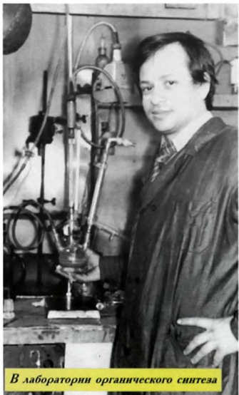
В лаборатории органического синтеза