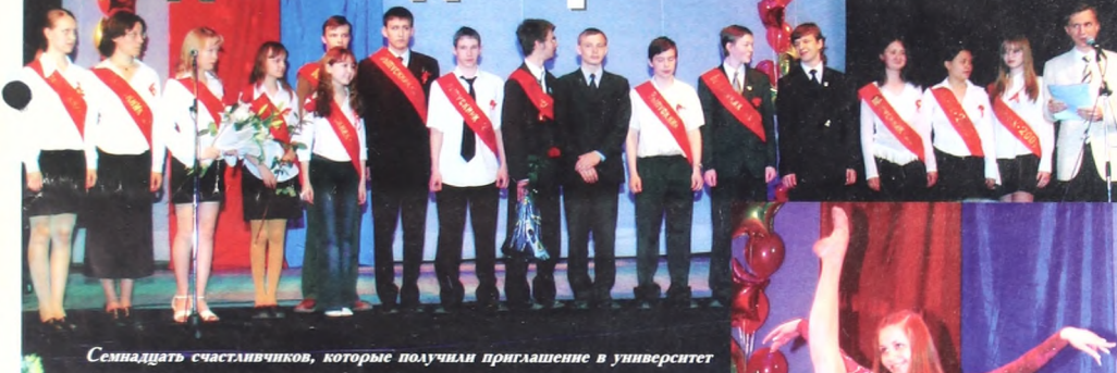
Семнадцать счастливиц, которые получили приглашение в университет