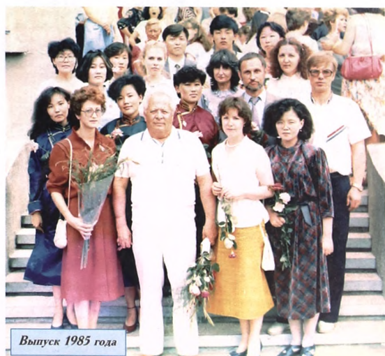
Выпуск 1985 года