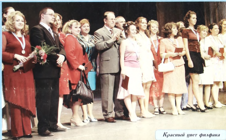
Красный цвет филфака