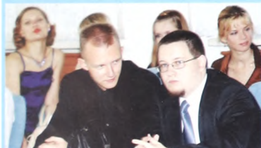
В ожидании диплома