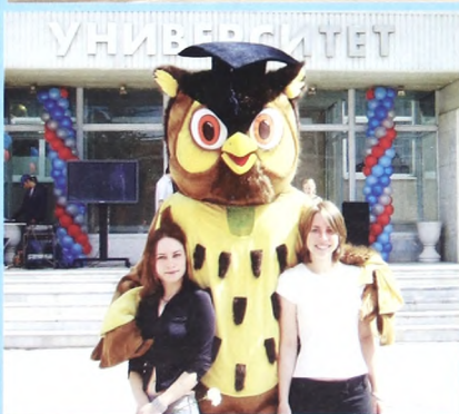
Филин пользовался спросом на студенческих гуляньях