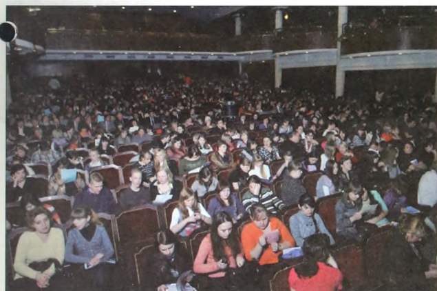
В зале и кулуарах аншлаг

Тюмень, 15 февраля. Большой зал филармонии. День открытых дверей Тюменского государственного университета