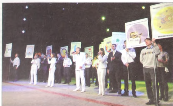
Студенты ТюмГУ поют гимн университета

Уральским вузам показали их место в системе мирового образования. ТОП-500 лучших вузов планеты