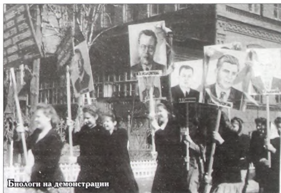
Бюлети на демонстрации

Наименование месяца (май), тесно связано с именем богини Майи - покровительницы земли и плодородия, которой поклонялись жители древней Италии. В первый день месяца мая по случаю окончания посевных работ ими устраивались торжества. Надо сказать, такие