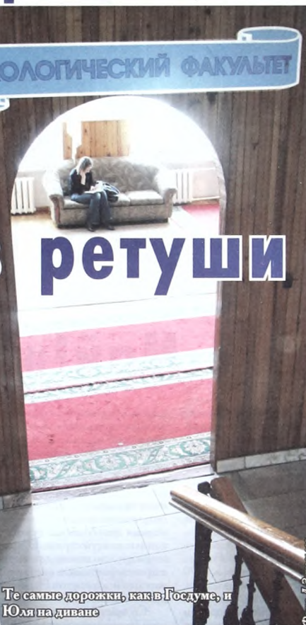
Те самые дорожки, как в Госдуме, и Юля на диване