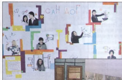
Творчество филологов и филологинь