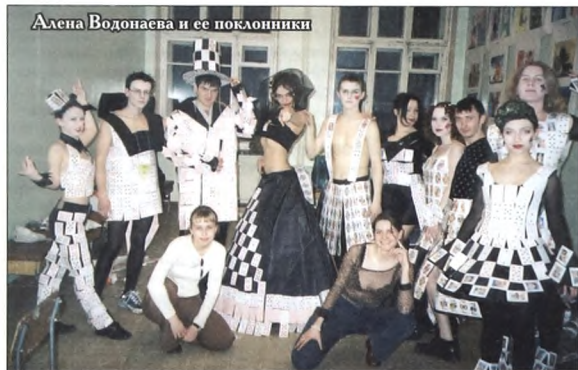
Алена Водонаева и ее поклонники

- Мне нравится филологический факультет. Особенно атмосфера в его коридорах. Там проявляется настоящая жизнь студентов филологического факультета. На стенах коридора время от времени студенты развешивают разные картины, фотографии, рисунки о своей жизни. А в Цюйфуском университете, в институте иностранных языков, я никогда не видела, чтобы студенты могли показать свою жизнь всем.