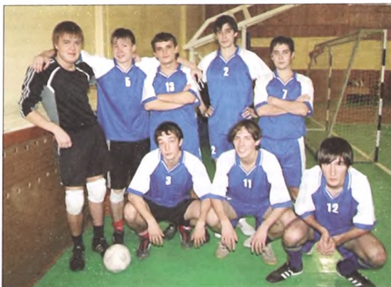
Футбольная сборная филфака

- Они говорят, что много. И на первом курсе их ужас берет, когда они знакомятся со списком обязательной для прочтения литературы. Но потом неожиданно для себя увлекаются, и чтение становится нормой и увлекательным занятием.