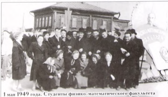
1 мая 1949 года. Студенты физико-математического факультета

А вот как отмечали праздник 1 Мая студенты и преподаватели нашего вуза в разные годы, я предлагаю узнать из фотографий музея истории ТюмГУ. Я думаю, вы здесь найдете много знакомых лиц.