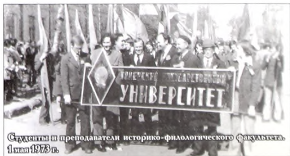
Студенты и преподаватели историко-филологического факультета. 1 мая 1973 г.