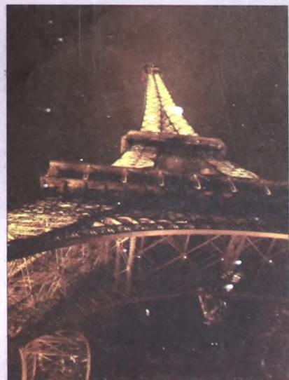
Франция. Фото Анастасии Стрепетиловой