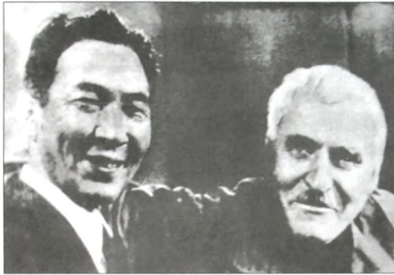
Х.Х.Якин с К.М.Симоновым