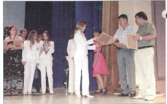
Награждение коллектива «Viva»