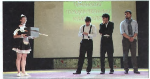
Команда КВН ТюмГУ

Праздник завершился гимном ТюмГУ. Для пятикурсников, которых заранее пригласили на сцену, он звучал в последний раз. Они, ставшие почти родными, стояли напротив нас. Про многих из них мы писали в газете не один раз, радовались их достижениям и вместе мечтали о новых. И теперь они смотрели в зал, полный студентов, и с грустью признавали, что их студенческая жизнь завершена. Но их победы и имена навсегда останутся вписанными в историю ТюмГУ.