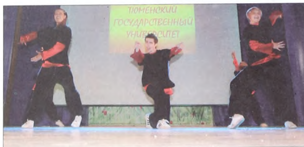
Совместное выступление хореографических студий «Step-up» и «Форсаж»