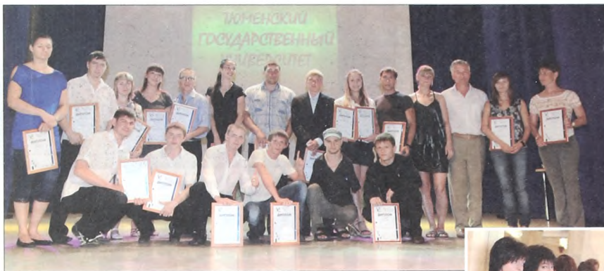
Лучшие спортсмены ТюмГУ