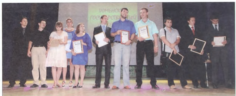
Интеллектуальная элита ТюмГУ