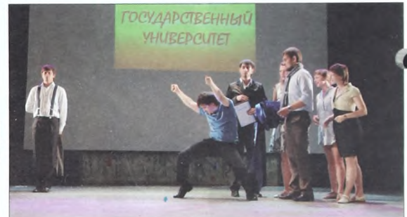
Миниатюра от студентов