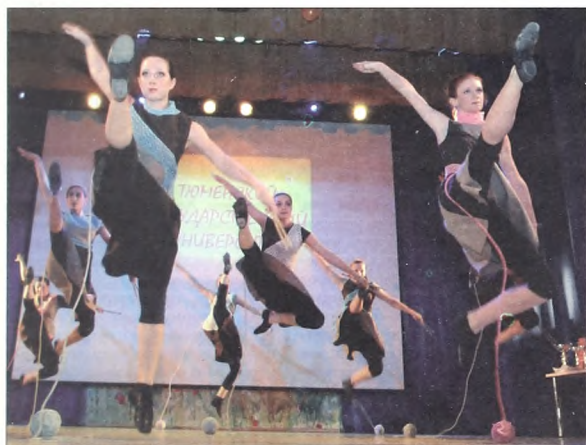
Хореографическая студия «Производная»

«Здесь всех сразу окутывает особая атмосфера» стр. 8