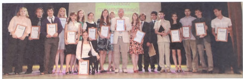
Лауреаты премии Президента России для талантливой молодежи