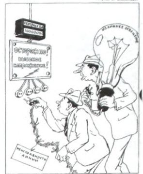
А не нас ли касается это предупреждение!

Но об этом, увы, вспомнили лишь полвека спустя, благодаря инициативе президента России Д.А.Медведева. Неужели в эру развития цифровой электроники и нанотехнологий по-прежнему будет сиять вольфрамовой спиралью расточительная лампочка Ильича? Она превращает в полезный свет не более 5% электроэнергии и ваших денег. «Умные», включающиеся от электронного датчика движения лампочки, давно используются в домах европейцев. Так пусть в долгие осенние и зимние вечера в наших квартирах зажгутся новые, энергосберегающие люминесцентные светильники, дающие желан-