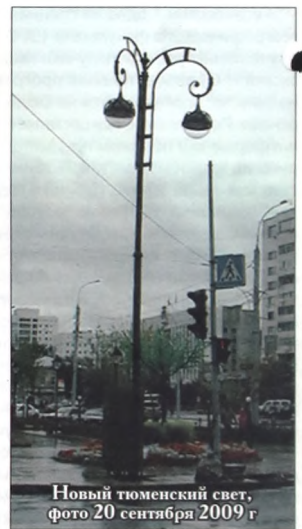
Новый тюменский свет, фото 20 сентября 2009 г