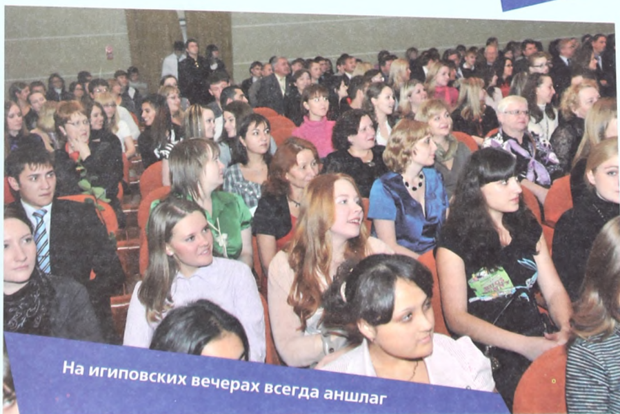
На игиповских вечерах всегда аншлаг