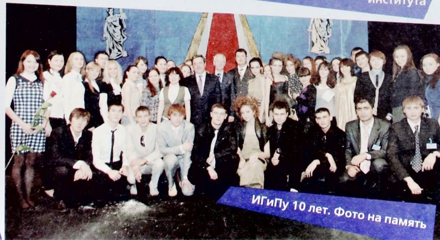
ИГиПу 10 лет. Фото на память