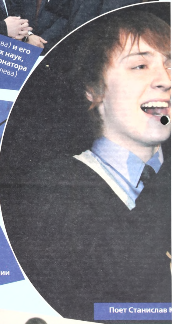
Поет Станислав К...