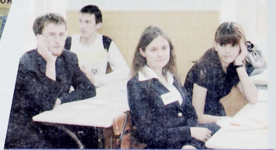
В институте учится 2757 студентов из разных городов Тюменской области, а также других областей Российской Федерации