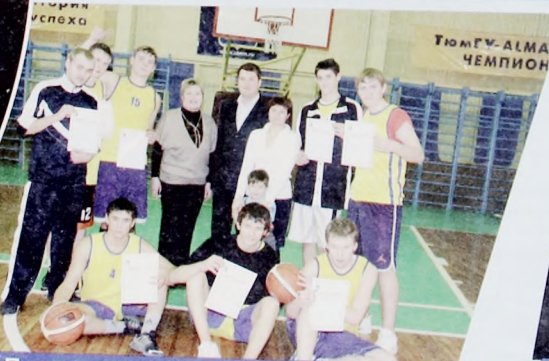
ИГиП - чемпион! Баскетбольная сборная института