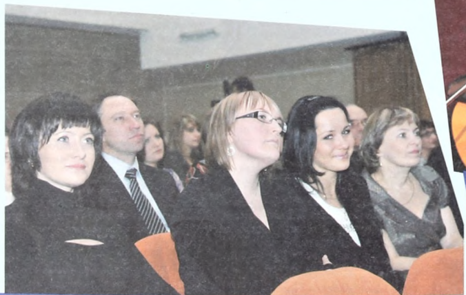
Недавние выпускники, теперь преподаватели ИГиПа