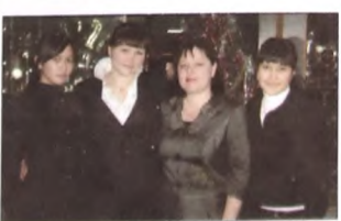
Команда школы с. Чикча (татарский язык)