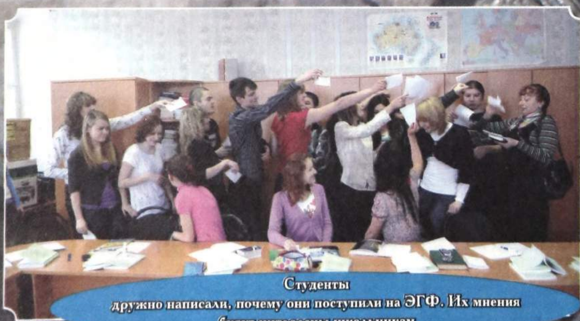
Студенты дружно написали, почему они поступили на ЭГФ. Их мнения будут интересны школьникам