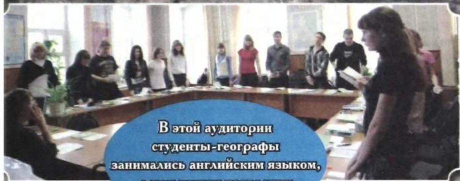
В этой аудитории студенты-географы занимались английским языком, а при нашем появлении дружно встали