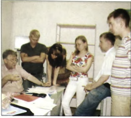
В аудитории ИДПО будущие аудиторы

- Именно так. Я позволяю себе всего три раза в год пойти на проверку. Этого достаточно, а гонорар хороший. Кстати, пока не забыла, с 2011 года меняется, и серьезно, требование закона, согласно которому мы сможем принять на обучение в рамках данной программы только тех, у кого стаж работы три года, и кто два последних года работал в аудиторской компании. И сам экзамен сдать еще сложнее, так как он будет включать все виды аудита.