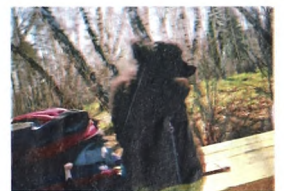
Егор после неудачного выступления в Омске

На той выставке я впервые вышла с карликовым пуделем Егором на ринг, и мы с ним крепко осясмились. А как вы хотите? Легко ли толстой, податливой и совершенно не спортивной тётке выскокить эдак козочкой со своим крошечным карликом при всём честном народе? Я плохо соображала, что делала, что говорил