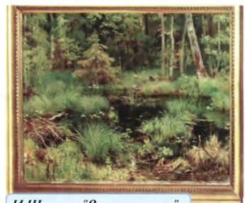
И.Шишкин "Родники в лесу".