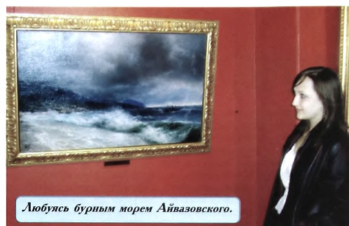
Любуюсь бурным морем Айвазовского.

С.Ф.Щедрин - один из первых русских художников, который начал работать на плакате, четкая светотень и выразительные переходы красок отличают "Большой фонтан в Капелламаре" (1810).