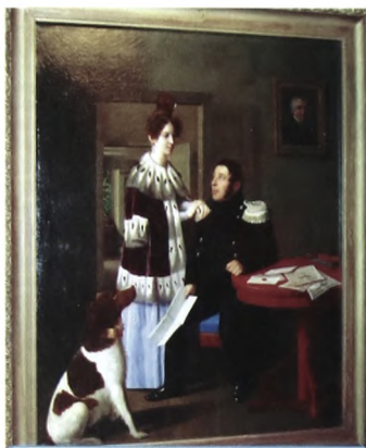
"Семейный портрет", неизвестный художник 1 пол. XIX века.

В прошлом году большая часть коллекции русской живописи XVIII - начала XX веков была отправлена в Третьяковскую галерею для экспонирования на выставке "Врата Сибири"