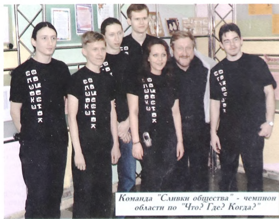
Команда "Сливки общества" - чемпион области по "Что? Где? Когда?"