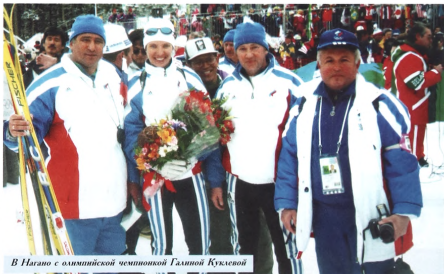
В Нагано с олимпийской чемпионкой Галиной Куклевой

- Засыпая, думать о тренировках? - А как же! И вместе с тем внутренне, психологически ты должен быть выше спортсмена. Но если вдруг ты не сможешь ответить на те или другие вопросы, то все, он с тобой расти не будет. А вот это уже тупик. Твой тренерский тупик в первую очередь.