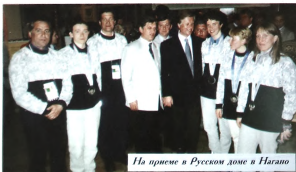
На приеме в Русском доме в Нагано