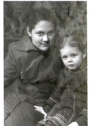
С мамой в Душанбе