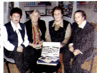
Встреча однокурсниц через много лет. Ноябрь 2005 г.

Со времени окончания пединститута не была в вузе. Побывав там, я пришла в неопишуемый восторг от