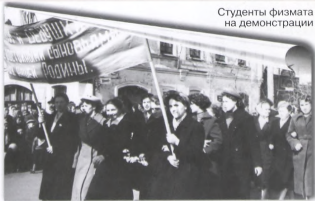
Студенты физмата на демонстрации