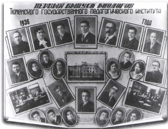
Первый выпуск биологов Тюменского государственного педагогического института. 1936 год

И еще, профессору присвоено высокое звание "Заслуженный работник высшей школы", к которому его представил университет. У него много разных наград. Но эту он считает самой дорогой.