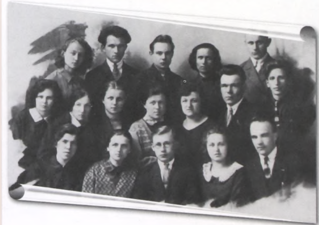
Первый выпуск физиков Тюменского государственного педагогического института. 1935 год