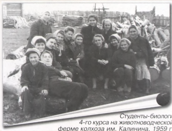
Студенты-биологи 4-го курса на животноводческой ферме колхоза им. Калинина, 1959 г.