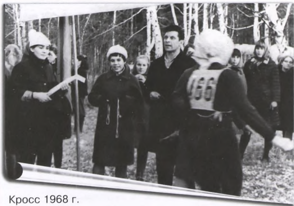
Кросс 1968 г.