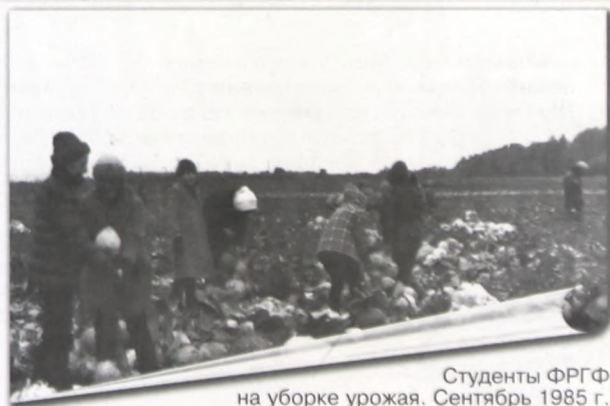
Студенты ФРГФ на уборке урожая. Сентябрь 1985 г.