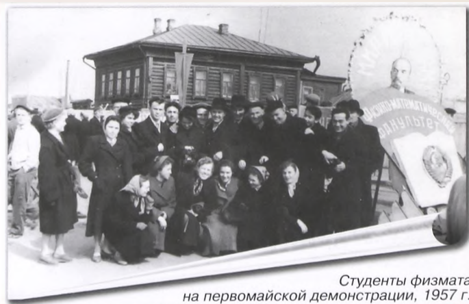
Студенты физмата на первомайской демонстрации, 1957 г.