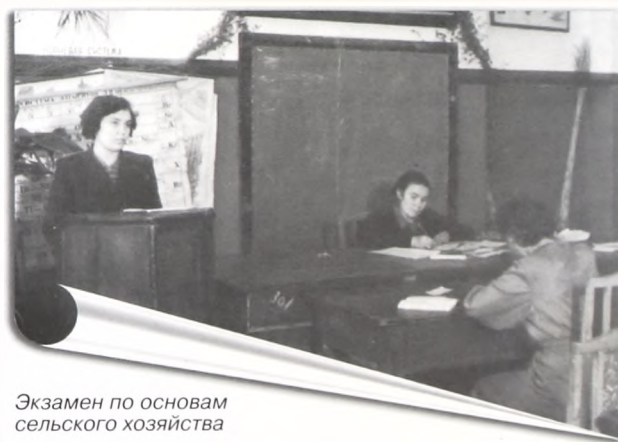
Экзамен по основам сельского хозяйства