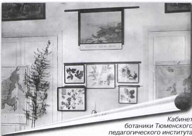
Кабинет ботаники Тюменского педагогического института