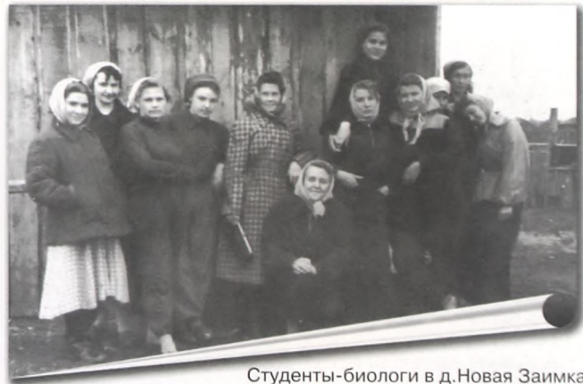
Студенты-биологи в д.Новая Заимка