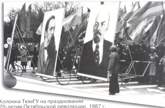
Колонна ТюмГУ на праздновании 70-летия Октябрьской революции. 1987 г.