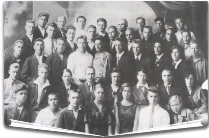
3-й выпуск студентов Тюменского педагогического рабфака. 1 июля 1935 г.