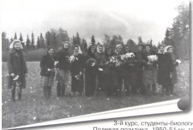
3-й курс, студенты-биологи. Полевая практика. 1950-51 уч. гг.