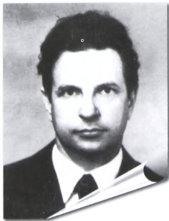
Первый ректор ТюмГУ И.А.Александров