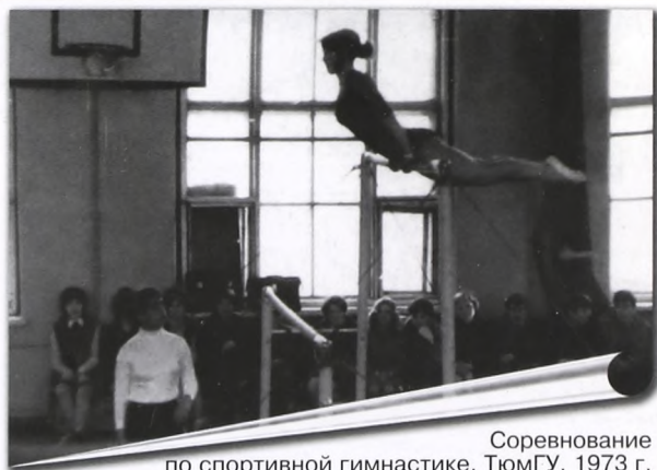
Соревнование по спортивной гимнастике. ТюмГУ, 1973 г.

- Помогает ли тебе твоя фамилия, известная на весь мир благодаря конструктору автоматов и пулеметов?