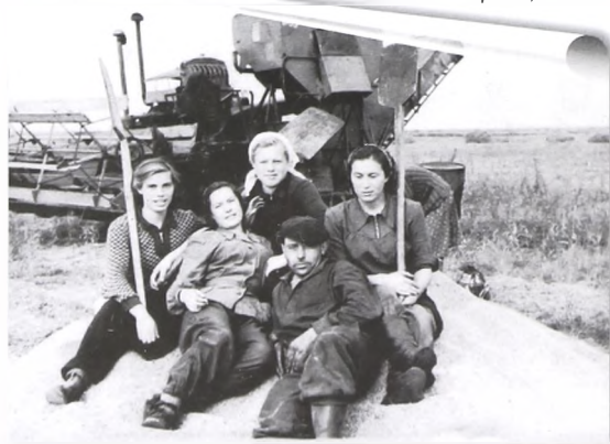
Студенты физмата в колхозе д. Лапазное Казанского р-на, 1954 г.