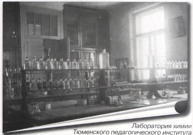
Лаборатория химии Тюменского педагогического института