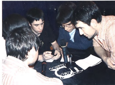
Минута обсуждения такая короткая...

Знаючи ТюмГУ уже с первого дня фестиваля занимали лидерские позиции, оставив далеко позади команды других вузов, в основном борьба за обладание призовыми местами велась между сборными университета "...слои", "FoUM" и "Дубы-кодуны". Во втором эшелоне шли команды из Нижневартовска и Сургута.