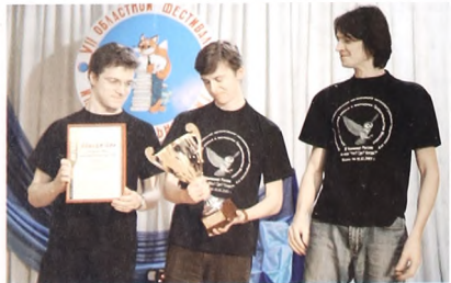
"Дубы-кодуны" - самые умные в области

Эти средства будут потрачены на приобретение самого современного оборудования, создание программного обеспечения, повышение квалификации преподавателей.