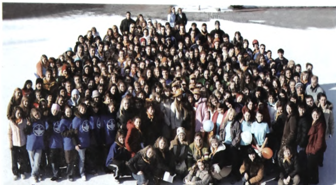
И СЛЁТ ЛУЧШИХ СТУДЕНЧЕСКИХ ГРУПП ВУЗОВ УРАЛЬСКОГО ФЕДЕРАЛЬНОГО ОКРУГА