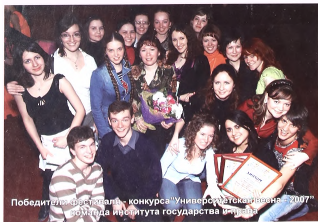
Победители фестиваля - конкурса "Университетская весна - 2007" команда института государства и права