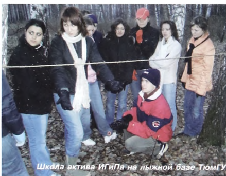
Школа актива ИГиПа на лыжной базе ТюмГУ

"В гимназии к нам относились как к взрослым людям. Ты пришел за знаниями, и никто тебя не держит. Нет некоего "аппарата заставления". И сейчас ты тоже понимаешь, если тебе надо знать теорию государства и права, ты это учишь в первую очередь для себя. Если нужно римское право, на котором основывается вся современная юриспруденция, ты в этом тоже начинаешь разбираться. Реагируешь на вещи как взрослый человек. Гимназия научила нас тому, что главное не оценка, а знания, с которыми ты выйдешь. Как и в гимназии, в ИГиПе многое направлено на то, чтобы сделать из студента не просто узкого специалиста, но дать более широкое образование и воспитание".