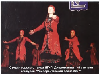
Студия горского танца ИГИП. Дипломанты 1-й степени конкурса "Университетская весна 2007"

Довольно стильную композицию с замечательными костюмами подготовила хореографическая студия "Сквозняк" института истории и политических наук, за что и была награждена дипломом лауреата в номинации "эстрадный танец".