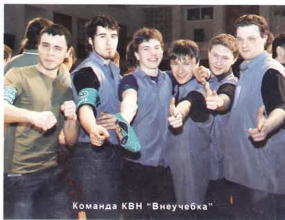
Команда КВН "Внеучебка"

Всегда ты будешь жить в наших сердцах, Институт государства и права! Года пройдут, но, думаю, останутся в умах Те знания бесценные, которыми гордится вся держава! О, наш родной Университет, С тобой связаны чудесные мгновения, Студенчеству дара зеленый свет И открывая путь свершений и побед, В ответ горит поток неиссякаемого вдохновения. Не важно, кто ты: юрист, налоговый или управленец, Мы - часть единой правовой системы. Храня закона дух, как ценность, как венец, Тем самым, государственность российскую оберегаем. Недаром говорили мудрецы: "Ученье - свет..." - Дерзай, послушай мой совет: "Учась в нашем вузе, знай, ждет тебя слава, Ты студент Института государства и права!"