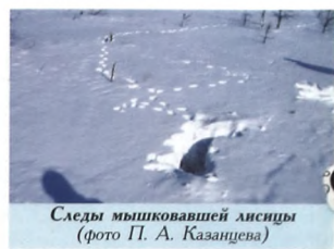
Следы мышковавшей лисицы

лесу. В другом месте мы нашли следы пирищества какого-то пернатого хищника, возможно, совы; на этот раз повезло большому пестрому дятлу.