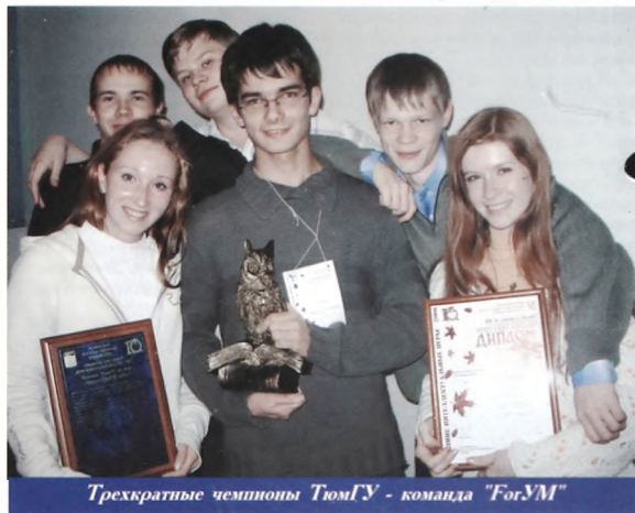
Трёхкратные чемпионы ТюмГУ - команда "ForUM"

Свечка - вопрос, который уже когда-либо задавался.