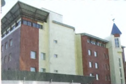
ОЧНАЯ ФОРМА ОБУЧЕНИЯ

Специальность: 032201.65 "Документоведение и документационное обеспечение управления"