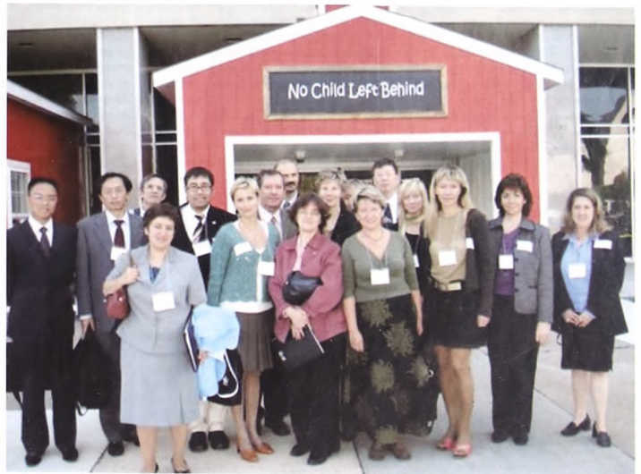
Выпускники программы IREX UASP 2006 г. у входа в Департамент образования США, Вашингтон

ференция по трансферу университетских технологий, где специалисты из разных стран смогут поделиться опытом успешной деятельности по внедрению разработок университетской науки в области рационального природопользования в производство, что, без сомнения, в высокой степени актуально для Тюменского региона.