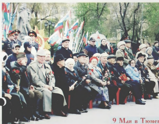
9 Мая в Тюмени